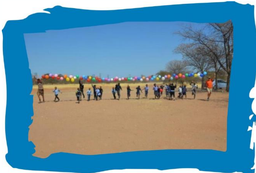
Blijde kinderen bij het feest van de opening van het eerste klaslokaal bij Boithuto in 2015