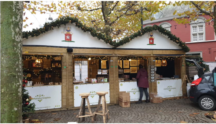
Vrijwilligers zijn heel december welkom in dit mooie kerstchalet middenop het Vrijthof in Maastricht!

3. Online shoppen? Denk aan de klik! Het is weer de tijd van shoppen en cadeautjes en soms ontbreekt het aan tijd om naar de overvolle winkelstraten te gaan. Als je online shopt, ga dan naar je favoriete webwinkel via 1 extra klik voor Boithuto en dan draagt de website waar jij iets besteld een fee af aan ons. Het kost jou niets en het levert Boithuto wat op! Niet alleen bekende websites als bol.com maar ook booking doet bijvoorbeeld mee, thuisbezorgd, action, hema, ali, airbnb, jumbo, coop, lidl, albelli enzovoorts!